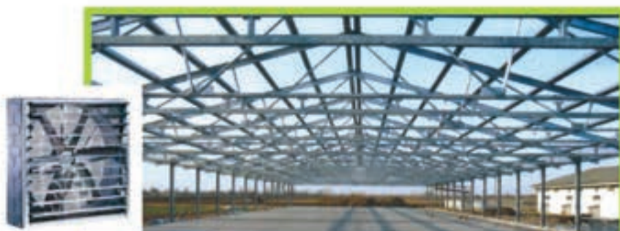
Προκατασκευασμένα μεταλλικά κτίρια από γαλβανισμένο σκελετό